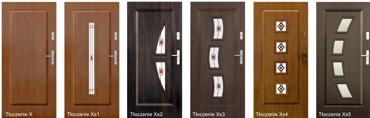
tłoczenie: X, Xs1, Xs2, Xs3, Xs4, Xs5 - ramka laminowana

Model KMT PLUS w kolorze złoty dąb i orzech ciemny w szerokości „90”