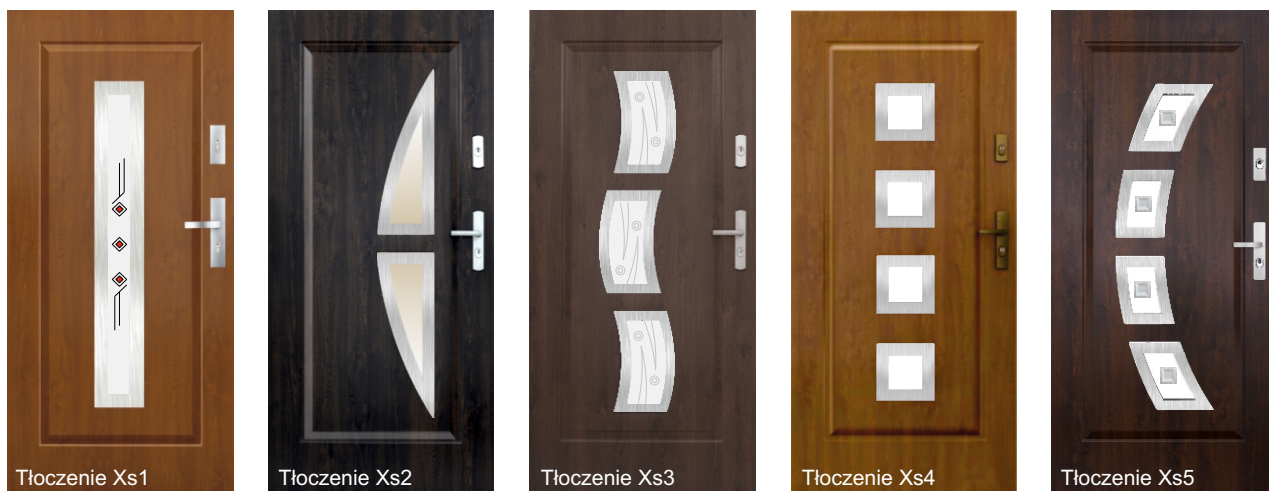
tłoczenie: Xs1, Xs2, Xs3, Xs4, Xs5 - ramka INOX